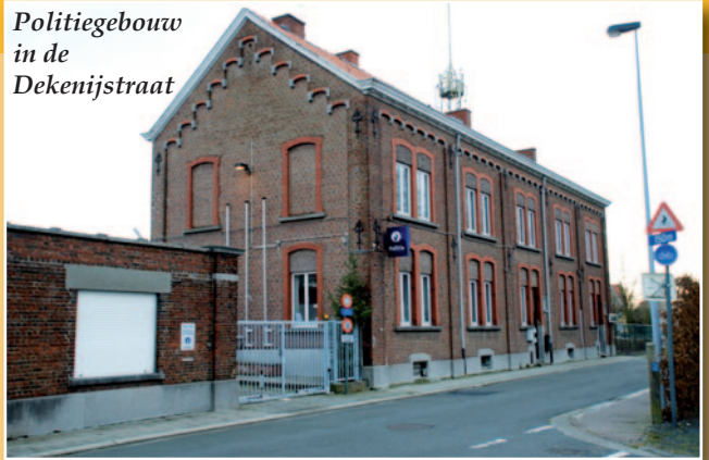
Politiegebouw in de Dekenijstraat

zakelijk. Alle gemeenten die deel uitmaken van onze politiezone moeten zoals Lochristi hierin hun verantwoordelijkheid nemen.