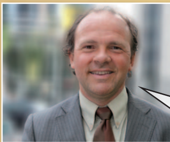
Philippe Muylers Vlaams minister van Financiën en Begroting

“Wie fouten maakte, wordt met rust gelaten”