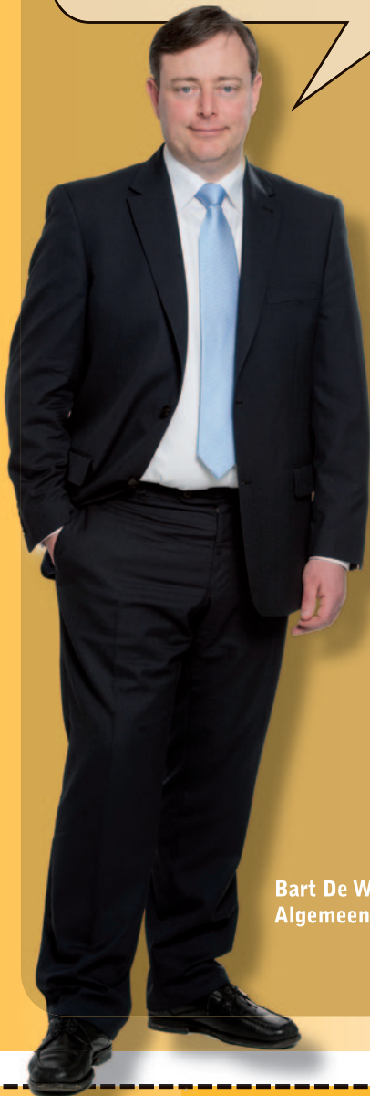
Bart De Wever Algemeen voorzitter N-VA

De N-VA kiest resoluut voor verandering. En ik vraag ook u om, samen met ons, die keuze te maken. Wil u de regering-Di Rupo weg, stem dan op 14 oktober op de N-VA!