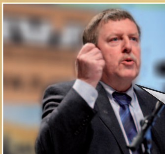
Siegfried Bracke N-VA-Kamerlid

“Het is goed in 't eigen hart te kijken”