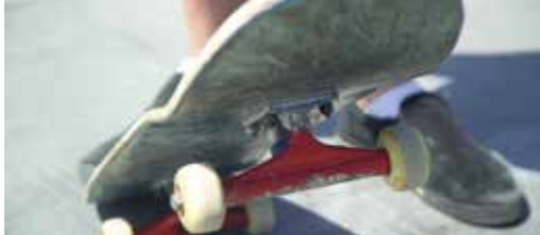
Nieuw skatepark voor en door jongeren p. 2