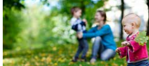
N-VA ijvert voor meer openbaar groen p. 3