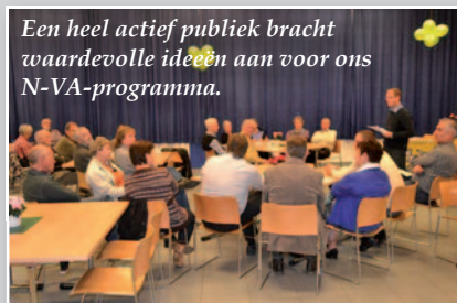
Een heel actief publiek bracht waardevolle ideeën aan voor ons N-VA-programma.

Na het startevenement met Siegfried Bracke in februari hielden we op 16 oktober onze tweede activiteit van het jaar.