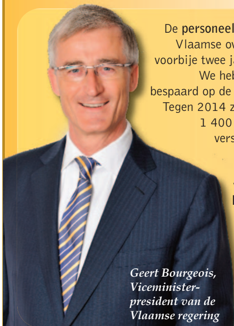
Geert Bourgeois, Viceminister- president van de Vlaamse regering

De personeelsbudgetten van de Vlaamse overheid daalden de voorbije twee jaar met 5 procent. We hebben ook drastisch bespaard op de werkingsmiddelen. Tegen 2014 zullen er bovendien 1 400 ambtenaren op de verschillende Vlaamse departementen niet stelselmatig vervangen worden. Een besparing van 50 miljoen euro per jaar!