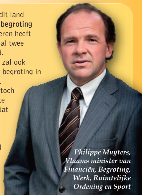
Philippe Muylers, Vlaams minister van Financiën, Begroting, Werk, Ruimtelijke Ordening en Sport

Als enige overheid in dit land heeft Vlaanderen een begroting in evenwicht. Vlaanderen heeft de voorbije twee jaar al twee miljard euro bespaard. De Vlaamse Regering zal ook de volgende jaren een begroting in evenwicht voorleggen. Als er geleidelijk aan toch wat budgettaire ruimte komt, investeren we dat zoals Europa vraagt: in onze economie (O&O, infrastructuur, werk ...) en in sociaal beleid (kinderopvang, wachtlijsten gehandicapten, kindpremie ...).