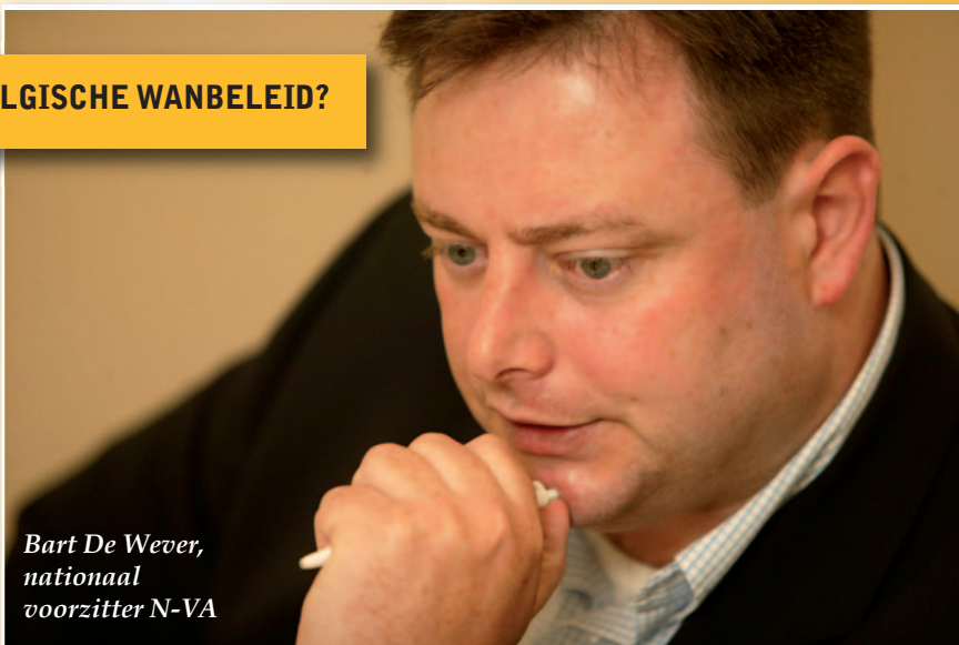
Bart De Wever, nationaal voorzitter N-VA

Want de socialisten dromen van hogere belastingen. Daarvan zullen vooral de Vlamingen de dupe zijn. En als het van Open Vld afhangt, moet Vlaanderen overschotten boeken zodat alle andere overheden de tekorten kunnen blijven opstapelen. Maar is het toeval dat de federale en de Brusselse regering, allebei met een Open Vld-minister van Begroting, de grootste tekorten hebben? Budgettaire discipline valt hen blijkbaar zwaar!