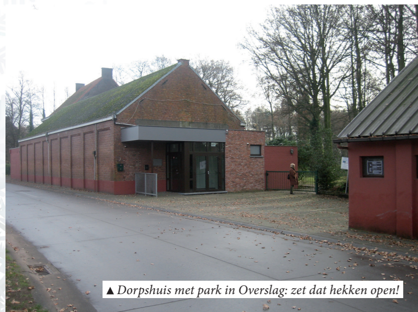
▲ Dorpshuis met park in Overslag: zet dat hekken open!

kun je vooralsnog niet spreken van een volwaardig dorpshuis met park. De N-VA vraagt om het hekken open te laten zodat de Wachtebekenaars kunnen genieten van de mooie parktuin. Bovendien wil de N-VA ook dat de mooie bomen blijven staan. Er worden vandaag al veel te veel bomen gekapt in onze gemeente en achteraf verloopt de vervanging maar povertjes.