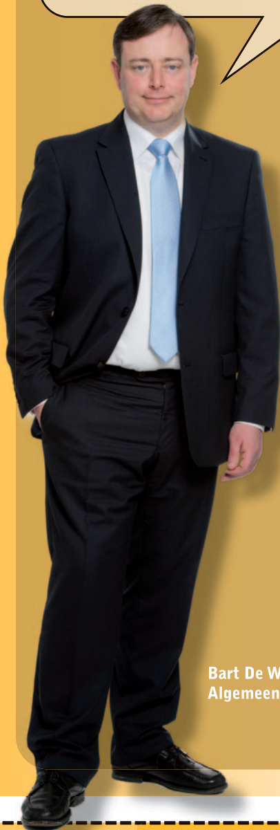
Bart De Wever Algemeen voorzitter N-VA

De N-VA kiest resoluut voor verandering. En ik vraag ook u om, samen met ons, die keuze te maken. Wil u de regering-Di Rupo weg, stem dan op 14 oktober op de N-VA!