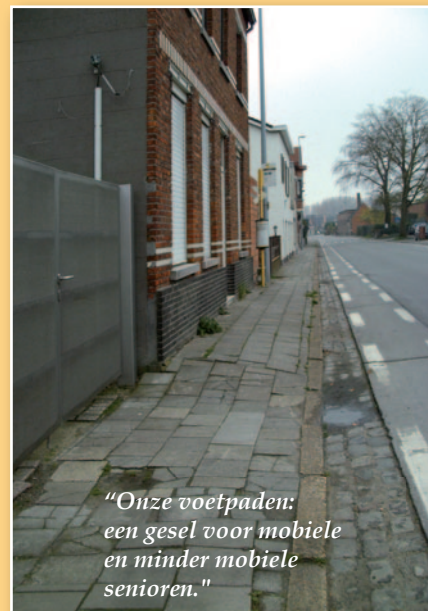
"Onze voetpaden: een gesel voor mobiele en minder mobiele senioren."