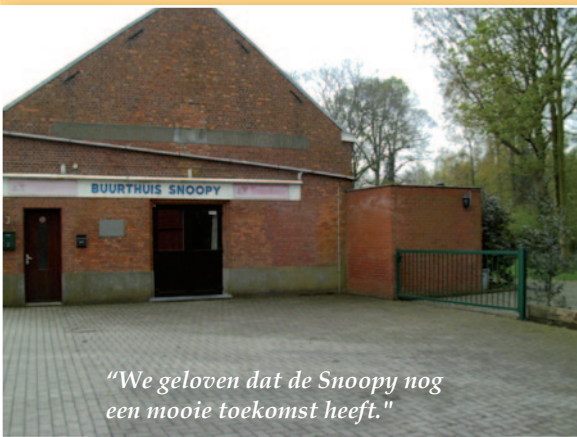
"We geloven dat de Snoopy nog een mooie toekomst heeft."